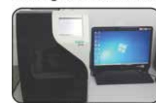
D-10 Hemoglobina Glicada