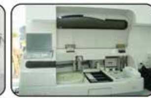
Elecys Marcadores Cardíacos