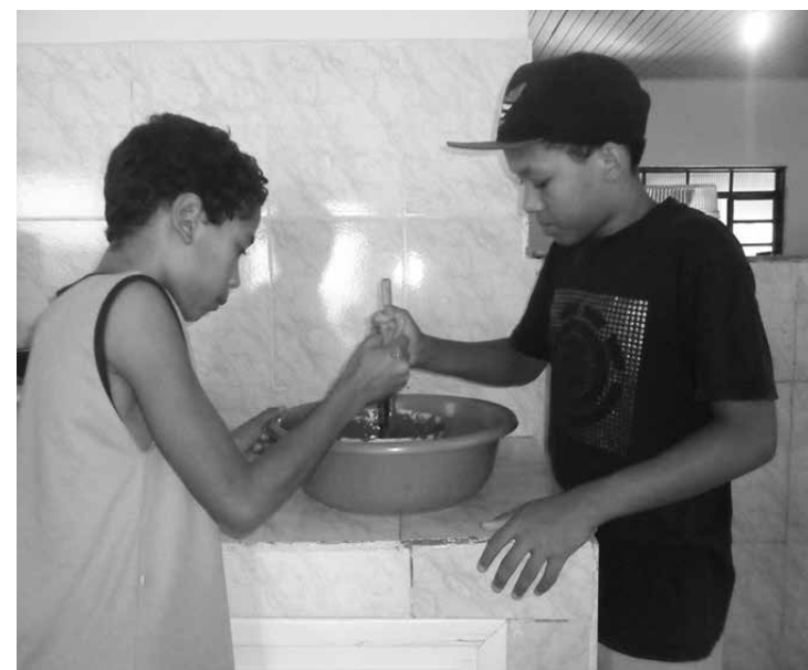
Alunos do Projeto Renascer participaram de uma oficina para a confecção de ovos de Páscoa

Além da oficina, também serão desenvolvidas atividades como narração de histórias, brincadeiras e jogos lúdicos, que visam estimular a criatividade e a imaginação de forma descontraída.