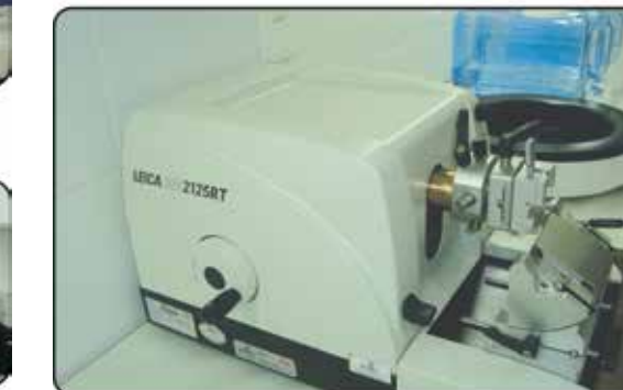
Microtomo - Anatomia Patológica