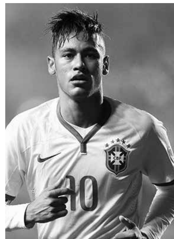
Neymar, com 24 anos, só passou por dois clubes e já ganhou mais de R$ 500 milhões

A seleção brasileira treina em Teresópolis, região Serrana do Rio de Janeiro, para as partidas pelas eliminatórias da Copa do Mundo.