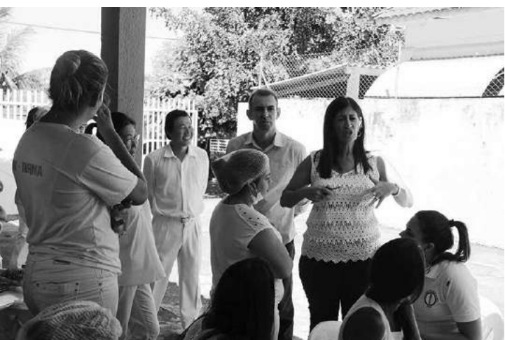
O presidente da Funec e a diretora pedagógica estiveram no local acompanhando os atendimentos