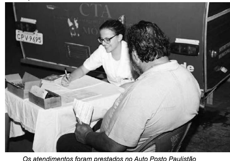
Os atendimentos foram prestados no Auto Posto Paulistão