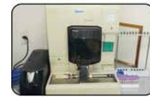
XT-1800 - Hematologia