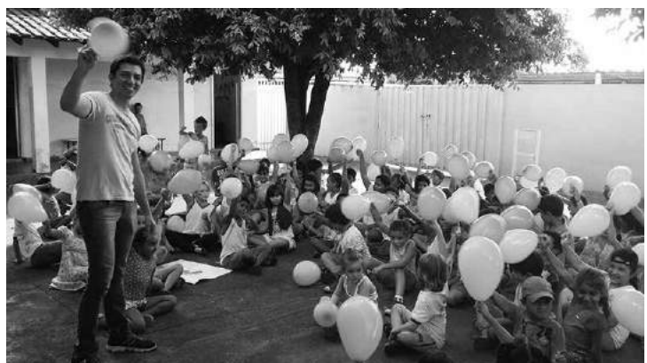
Os alunos participaram de atividades educativas