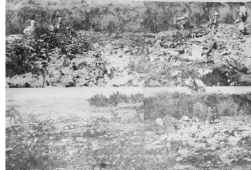
O "lixão", próximo à vila Santa Cruz, é um dos grandes focos de proliferação das moscas.

A cidade besta infestada de moscas varejeiras que, como enxames de abelhas, invadem casas, pousam sobre alimentos, aninha-se em latas de lixo e restos de comida, pondo grande quantidades de ovos que, logo depois, transformam-se em larvas e em novas moscas. Há caso de crianças que, com pequenas feridas ou machucados, foram atacadas por moscas varejeiras e chegam até ser hospitalizadas.