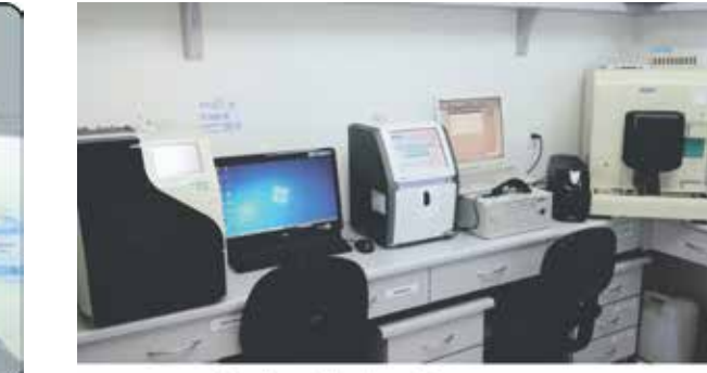
Sala I de Exames