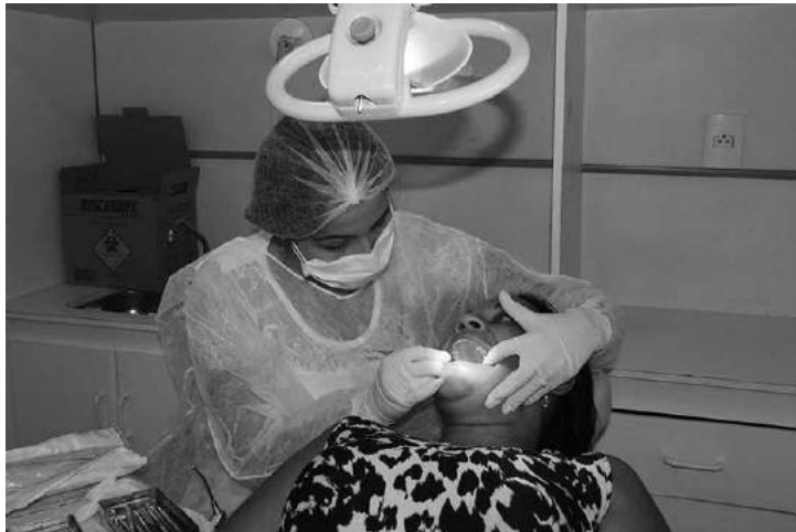
Os alunos realizaram atendimentos nas casas e no Trailer de Odontologia