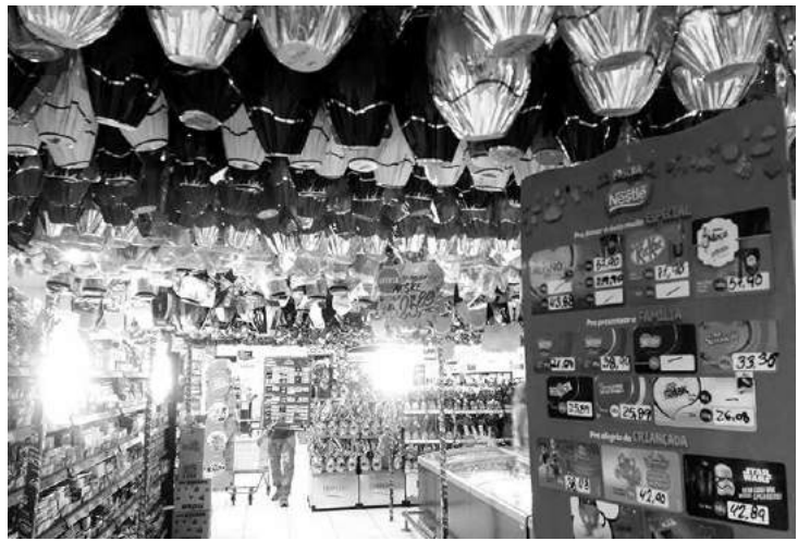
Representantes de alguns supermercados de Santa Fé relataram que tiveram aumento nas vendas dos ovos industrializados

pelos supermercados. Apenas o grupo de refrigerantes/cervejas e azeites tiveram encomendas maiores, com um percentual de 3,2% e 0,7%, respectivamente.