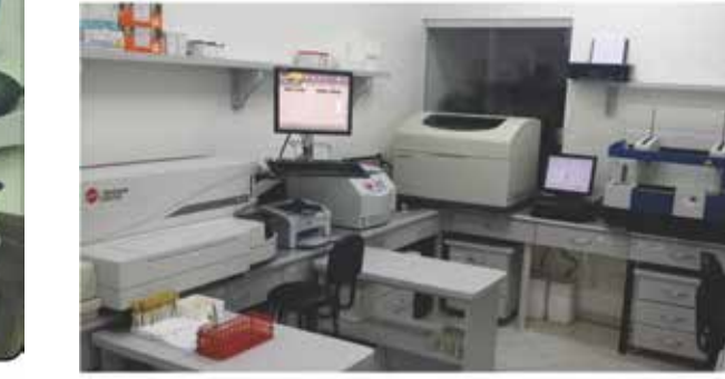
Sala II de Exames