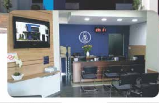
JALES - I

Av. João Amadeu, 2042 Centro - CEP 15700-078 Fone (17) 3632.1716