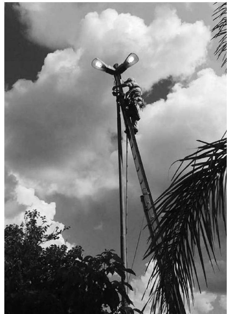
Todas as lâmpadas queimadas já foram trocadas por novas

O morador que identificar qualquer problema deve ligar para o 0800-7711135, se identificar e passar informações de onde se encontra o defeito, como nome da rua, bairro e algum ponto de referência.