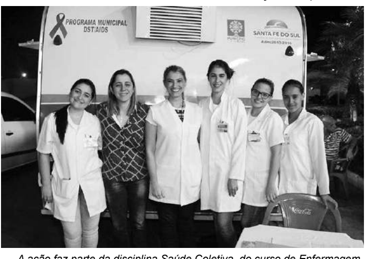
A ação faz parte da disciplina Saúde Coletiva, do curso de Enfermagem