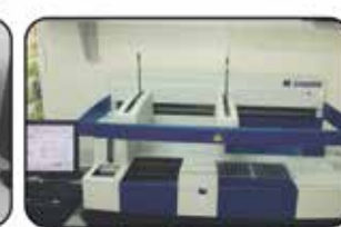
Liaison - Imunologia