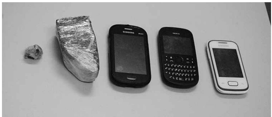
Foram apreendidos uma quantidade de entorpecente e três celulares