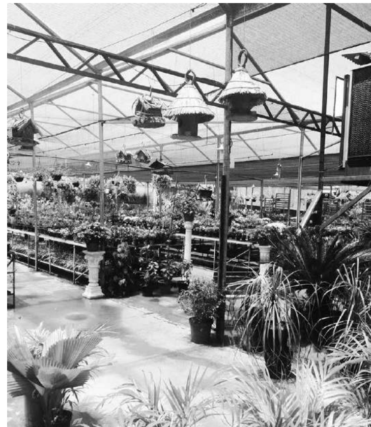
A floricultura Moby Dick é a mais tradicional da cidade