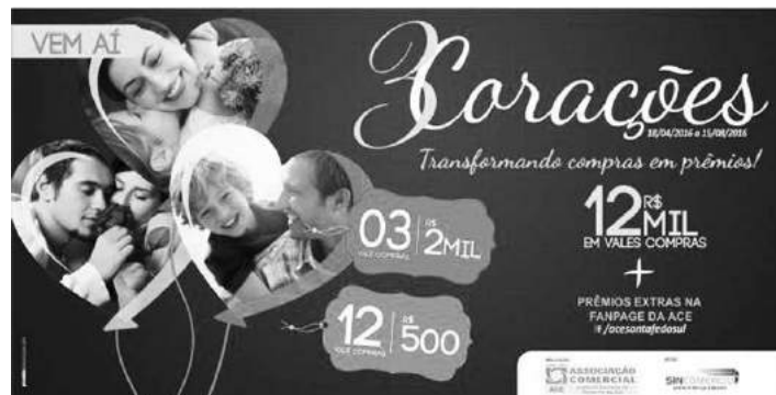
A promoção abrangerá três datas comemorativas

Any estava noiva, e, tanto em sua linha do tempo do Facebook quanto na de seu noivo, amigos e familiares publicaram frases de conforto e indignação quanto à morte da jovem, que era muito querida e conhecida em Santa Fé e região.