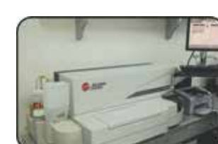
Access2 Dosagens Hormonais