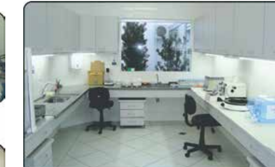
Sala - Anatomia Patológica