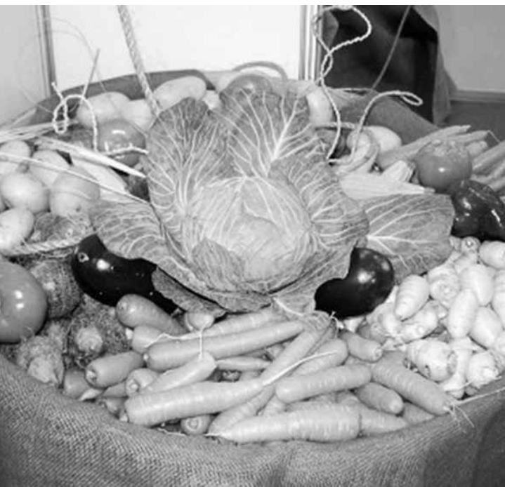
O Projeto em 2015 foi um sucesso

O valor do projeto é de R$ 209.500,00, para dividir com os produtores rurais participantes, sendo que o valor máximo para cada produtor não pode ultrapassar R$ 20.000,00, conforme a lei. Essa divisão de repasse acontece dependendo da quantidade e do tipo de produto entregue pelos produtores rurais.